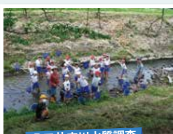
②三井庄川水質調査