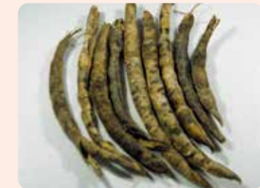
かび粒が発生した莢