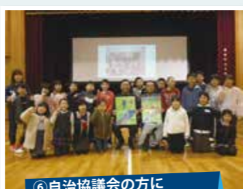
⑥自治協議会の方にポスターを渡しました