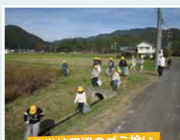
⑤学校周辺のゴミ拾い