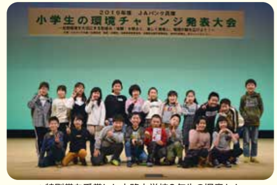
▲特別賞を受賞した大路小学3年生の児童たち

JAバンク兵庫が主催する「JAバンク兵庫 小学生の環境チャレンジ発表大会」(地区大会)が加西市の加西市民会館で行われました。各地区の代表6校が取り組み内容を発表。当JA管内からは大路小学が出場しました。 県内のJAとJA兵庫信連で構成する「JAバンク兵庫」は、地域貢献活動の一環として、環境保全教育活動に取り組んでいる小学校を応援しています。今年度も当JA管内では、川の周辺の生き物調査、農作物の栽培などを通じた環境保全教育を積極的に取り組まれた小学校に対して、活動助成を行いました。 発表大会では、大路小学3年生20名が、元気良く取り組み内容や感想を発表し審査の結果、最優秀賞にあたる特別賞を受賞しました。児童たちは、満面の笑みで受賞を喜び合っていました。