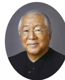
(学) 服部学園 服部栄養専門学校 理事長・校長