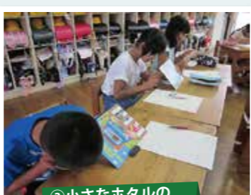
③小さなホタルの幼虫を観察