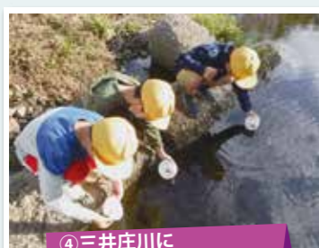
④三井庄川にホタルの幼虫を放流