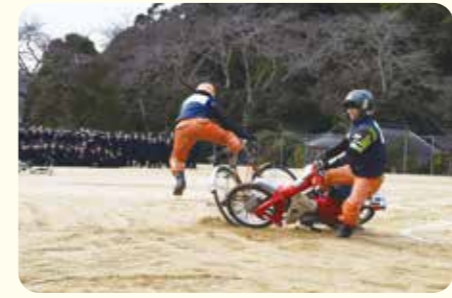
▲事故の実演をするスタントマン

当JAとJA共済連、丹波警察署は県立柏原高等学校で、自転車交通安全教室を開催しました。当JAでは、地域貢献活動の一環として開いており、全校生徒や教職員ら約700人が受講し、自転車の運転マナーなどを学びました。 スタントマンらが、携帯電話を使用しながらの片手運転や、ヘッドフォンをつけての運転など、事故につながる違反を実演しました。 教室を受講した生徒は「実際に目の前で見て、音と衝撃がすごかった。自転車は身近で便利なものだが、改めて事故の怖さを知るいい機会になった」と話していました。