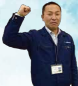
春日宮農経済センター 足立宮農相談員

大きくマ色鮮やか。高級和菓子の材料として昔から愛用されています。殿中で抜刀しても切腹しないですむ大納言に例えられその名の由来になっています。