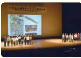
▲ステージで発表する児童たち