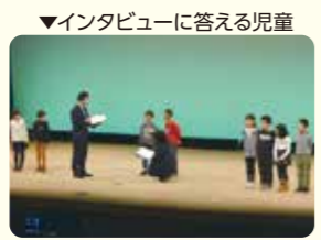
▼インタビューに答える児童