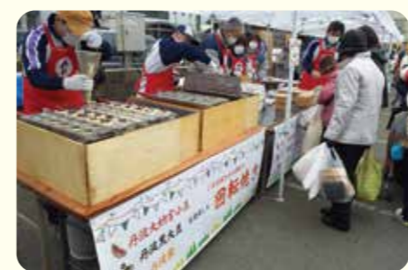
▲回転焼きに並ぶ来場者

丹波市「味覚フェア」実行委員会は、今年度2回目となるたんぱルシエ2019を柏原市街地で開催しました。 当JAでは、丹波市の特産物である丹波大納言小豆・丹波黒大豆・丹波栗が入った「回転焼き」や丹波山の芋を使用した「素揚げ山の芋」、また但馬牛の「焼肉」、旬の農産物を取り揃えた「出張とれたて野菜直売所」を出店し、多くの来場者で賑わいました。 丹波市の特産物が3つ入った回転焼きは、特に人気が高く約600個を完売しました。今後も当JAでは、同市の魅力ある農産物を幅広くPRしていきます。