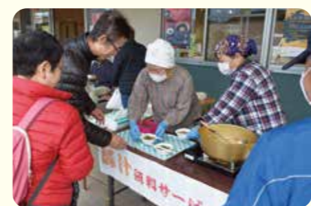
▲豚汁を振舞う担当者

とれたて野菜直売所で、令和2年の初市イベントを開催し、店頭での豚汁無料サービスや福袋の販売を行い、新しい年のスタートを切りました。 当日は生産者の皆さまが朝早くから様々な農産物を出荷され、開店時には、新鮮な野菜や加工品などが店頭に並びました。また、数量限定で販売された福袋には、小豆茶や人気のエコップ商品が入っており、ご購入された方に大変好評でした。 そして、来店された方には豚肉や野菜がたくさん入った豚汁を振舞い「おいしい、体が温まる」などと喜んでいただきました。