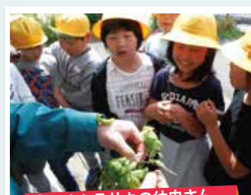
①オオムラサキの幼虫さん、こんにちは!

私たちはこの豊かな自然環境を大路の自慢とし、これからも大切にしていきたいと思えます。