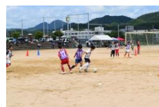
J Aバンク兵庫サッカー教室