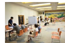
健康寿命向上健診