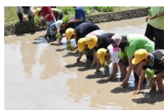
田んぼの学校（田植え）