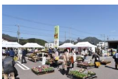
第19回春の大感謝祭 ～花のフェスティバル～