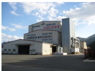
春日ライスセンター

将来を見通した施設整備及び効率的な施設運営体制の構築に向け、柏原RC荷受施設化改造工事、氷上CE施設内PLC更新・籾摺設備更新・色彩選別設備更新、春日RC貯蔵ビン増設工事を実施し、基幹調製施設（氷上CE・春日RC）を中心とした共同乾燥調製施設の集約・合理化に取り組みました。