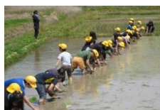
田んぼの学校（田植え）