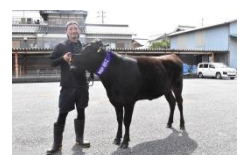
丹波市畜産共進会