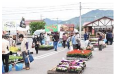
第20回ＪＡ丹波ひかみ春の大感謝祭