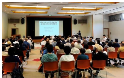
小豆・黒大豆初心者向け講習会の様子