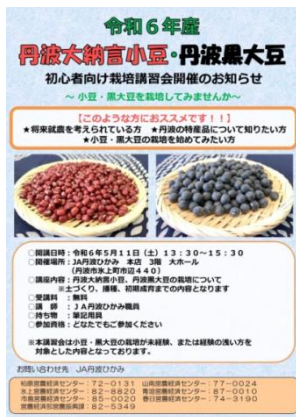
栽培講習会の案内チラシ

特産物の新規栽培者増加を目的に、定年帰農者等新規栽培希望者を対象とした初心者向け栽培講習会を開催し、兼業農家等事業継承者の育成に取り組みました。