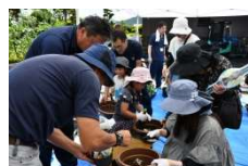
サマーフェスティバル