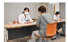
健康寿命向上健診