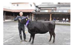
丹波市畜産共進会