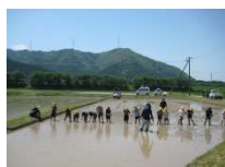
田んぼの学校（田植え）