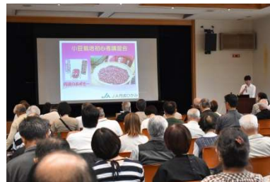
小豆・黒大豆初心者向け講習会の様子