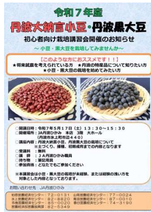
栽培講習会の案内チラシ

特産物の新規栽培者増加を目的に、定年帰農者等新規栽培希望者を対象とした初心者向け栽培講習会を開催し、兼業農家等事業継承者の育成に取り組みました。