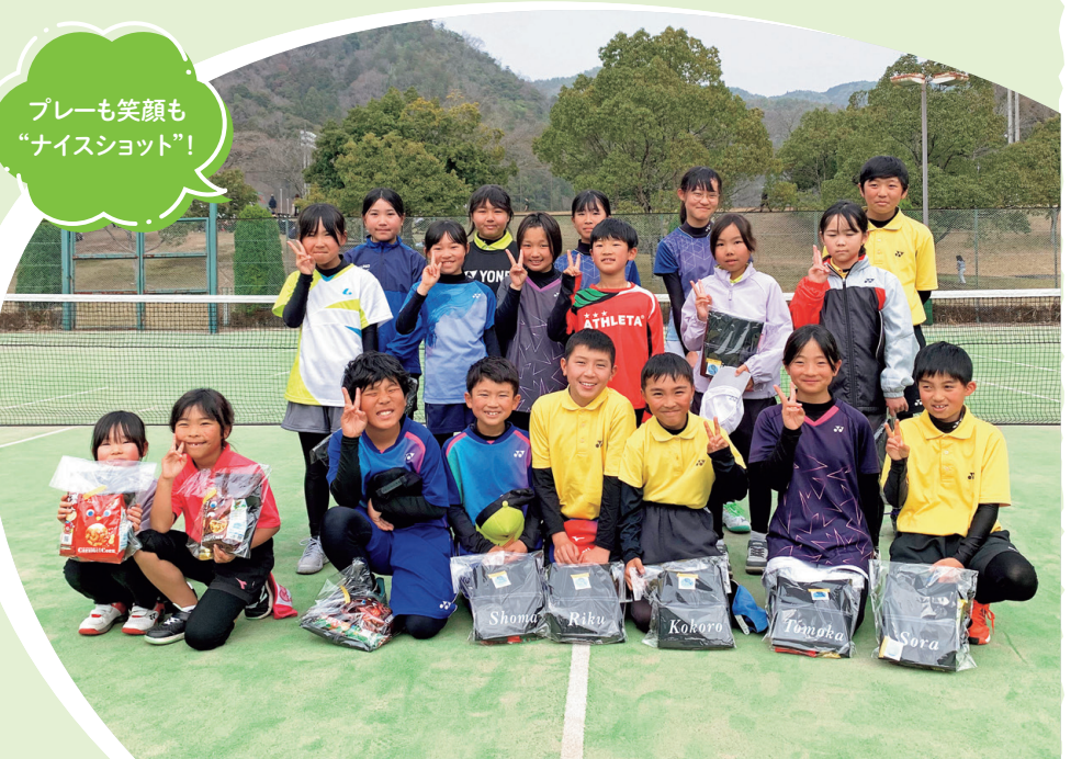
プレーも笑顔も “ナイスショット”！