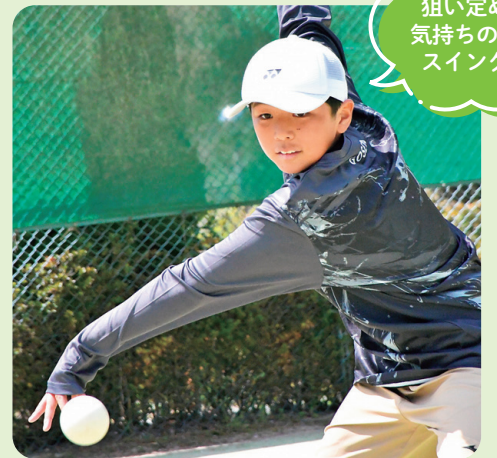
狙い定めて 気持ちのいい スイング！