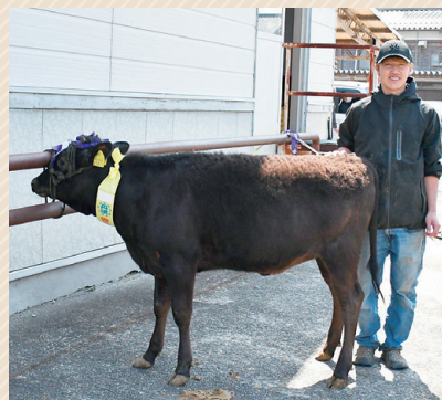
雌牛の部、一等一席に選ばれた(株)荻野牧場