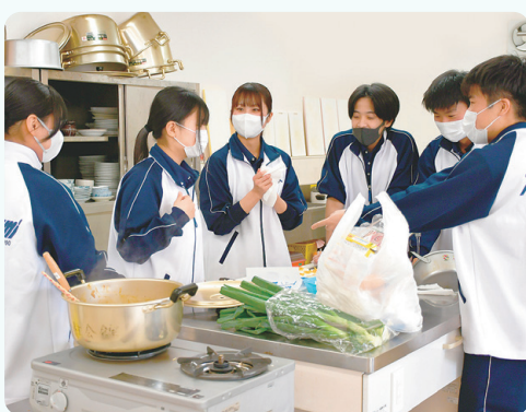
アイデアを出し合う新入職員

新入職員が社会人としての自覚を持ち、配属後に円滑に業務を始められるように構成されている新入職員研修で、昨年度から新たに「カレー調理実習」が加わっています。